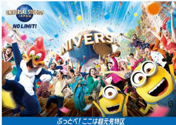
ぶつとべ! ここは超元気特区

※画像はイメージです。パークでは、衛生強化対策へのご協力をお願いします。 詳しくはユニバーサル・スタジオ・ジャパン公式WEBサイトをご確認ください。 *JCBは、ユニバーサル・スタジオ・ジャパンのオフィシャル・マーケティング・パートナーです。 Minions and all related elements and indicia TM & © 2023 Universal Studios. All rights reserved. © Walter Lantz Productions LLC. TM & © Universal Studios. All rights reserved. CR23-1363