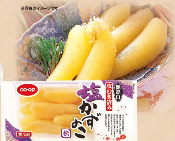
COOP 数の子 200g(トレーあり)/袋