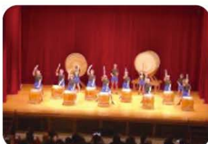
11月の田野総合文化祭