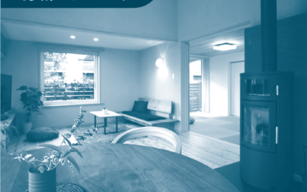
太陽熱を利用した床暖房はファンの電気代のみ 月間500円