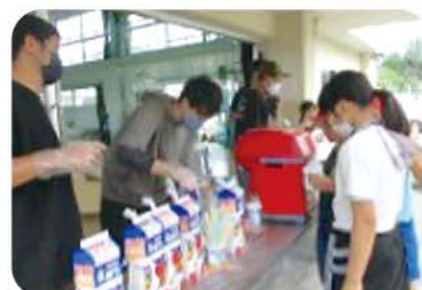
PTA主催のデイキャンプ。PTAも熱心に活動してくださっています。