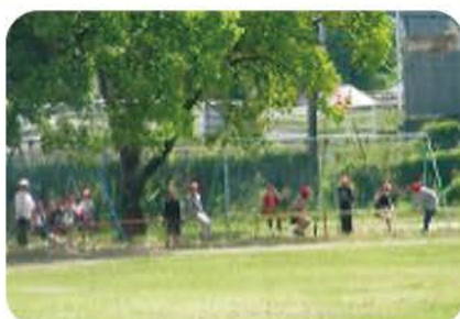
昼休みは、学年の隔てなく、みんなで仲良く遊んでいます。