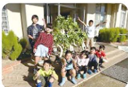
地域と連携した「七野小ならではの教育」が展開されています。

現在の全校児童数が49名。そのうち小規模特認校制度を利用している児童数が25名。本年度は、制度利用の児童数が、初めて半数を超えました。この制度によって、児童数の維持とともに、児童に互いの違いや良さを認め合い、他を尊ぶ態度が育まれています。